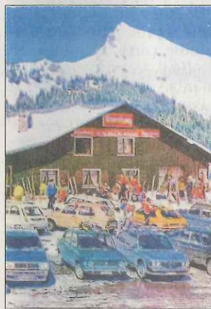
Ce 28 décembre, le public découvrira les débuts de la station et son histoire avec la projection d'un film à la salle polyvalente de Sommand.

Aujourd'hui, à Mieussy après la visite commentée de l'espace Croq'Alp, le public pourra mettre la main à la pâte et fabriquer lui-même sa tomme blanche. Rendez-vous à la fruitière de Mieussy à 9 h 15.