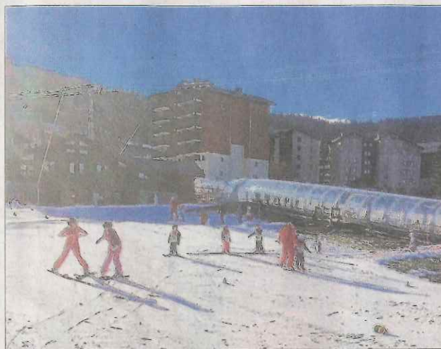
O.L. Le domaine débutant des Esserts permet aux apprentis skieurs d'effectuer leurs premiers virages. Photo Le DL/O.L.

Aux Esserts comme ailleurs, le personnel des remontées mécaniques et les moniteurs de ski ont dû répondre à l'appel de la pelle pour aménager quelques arpentés de pistes et permettre ainsi aux skieurs débutants d'éprouver les plaisirs de la glisse.