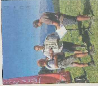
Ambiance festive et champêtre pour cette randonnée amicale au sommet.

La 14 e édition de cette randonnée familiale et villageoise a bénéficié ce dimanche d'un chaud et beau soleil. Ces conditions idéales ont incité nombre de Lhottis à prendre le départ de cette balade et à gagner les hauteurs du territoire communal pour se retrouver face au mont Blanc sur le plateau de Lairon. Ils ont été accueillis sur place par l'équipe de l'office de tourisme et par plusieurs bénévoles qui n'ont pas chômé pour préparer et servir le succulent repas champêtre à plus de 150 convives. Les ails d'accordéon et l'ambiance festive ont fait le reste. A tel point