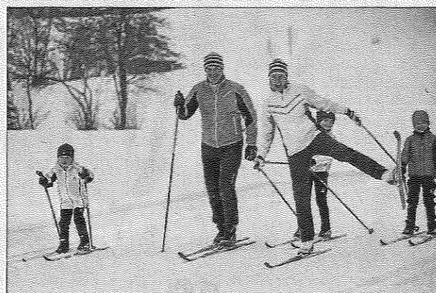
Une belle journée en perspective à passer en famille ou entre amis. Pour l'occasion l'accès au domaine nordique sera gratuit pour les participants.

Demain, du côté des montagnes de la station de Praz de Lys Sommand, la journée se vaudra tonique et ludique et fera la part belle à toutes les disciplines nordiques.