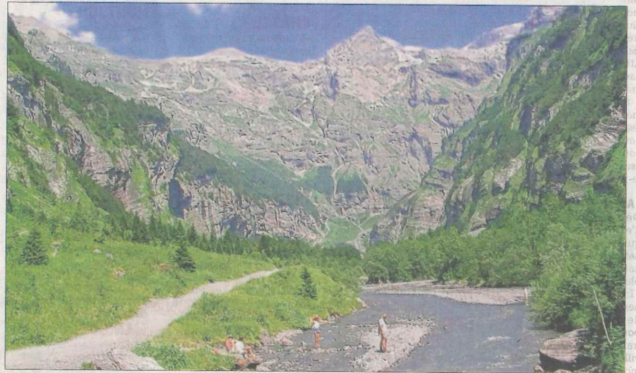
Le site du Fer-à-Cheval offre un paysage exceptionnel.

Situé au cœur de la réserve naturelle de Sixt-Passy, le cirque du Fer-à-Cheval est un endroit où la nature révèle toute sa splendeur. Sur place, de nombreuses randonnées pédestres attendent les visiteurs. Sans oublier un sentier thématique, des balades à cheval et à poney, une longue-vue gratuite pour observer sommets et cascades, des visites commentées avec des gardes de la réserve, le hameau du Frénalay, le bar-restaurant du Fer-à-Cheval, un snack au camping du Pelly, les buvettes du Prazon et du Boret ou le refuge de la Vogelle. Quant au "chalet-accueil" de l'office de tourisme et de la réserve naturelle, il est ouvert tous les jours (sauf le samedi) de 10 heures à 12 heures et de 14 heures à 18 heures (exposition sur la nature, plan des circuits pédestres...). Les chiens sont acceptés tenus en laisse jusqu'à la buvette du Prazon.