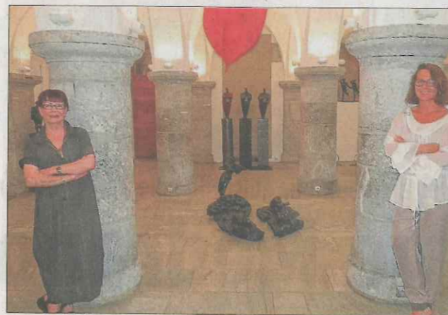
La sculptrice Elisheva Engel et la peintre Alexandra Nietzer-Winterberg exposent leurs œuvres jusqu'au 23 août.

C'est une exposition aux qualités rares que la Société des maçons présente dans la salle des écuries du château jusqu'au 23 août. Une somptueuse exposition réalisée à quatre mains par deux artistes de renommée internationale : la sculptrice Elisheva Engel et la peintre Alexandra Nietzer-Winterberg. De cette union provisoire entre les deux femmes naît une galerie d'œuvres en mouvement, d'histoires et de rencontres contemporaines, de convergences de points de vue, de sublimation d'un quotidien insaisissable. Elisheva Engel a